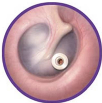
Trommelvlies met trommelvliesbuisje